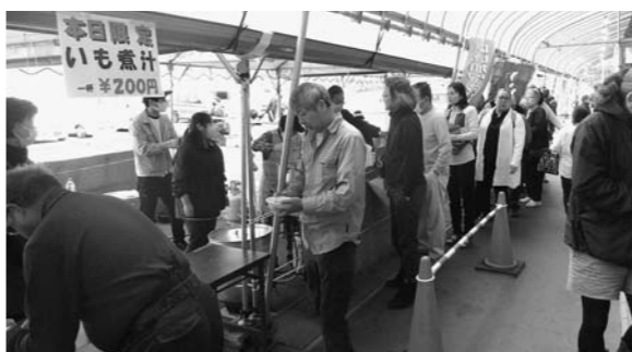
▲いも煮の前には長蛇の列