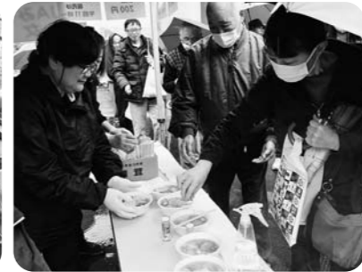
女性部の協力で作られた芋煮を買い求める来場者