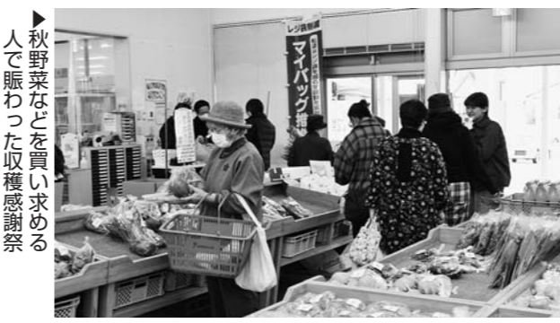
▶秋野菜などを買い求める人で賑わった収穫感謝祭

ごん産直収穫感謝祭が11月15日、産直ごん広場で開きました。開店と同時に白菜や青菜、大根、ねぎなど秋野菜も特価で販売され、買い求める人で賑わいました。店舗前では屋台コーナーも設けられ、やきとりや人気の高い「はいからさんのカリパン」などを販売。500円以上お買い上げいただいた方には粗品がプレゼントされました。