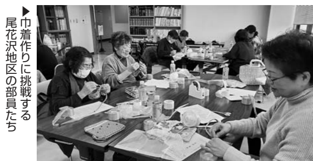
▶巾着作りに挑戦する尾花沢地区の部員たち