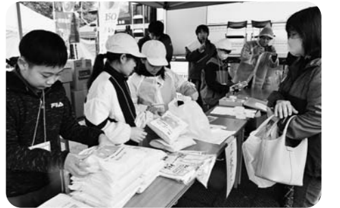
戸沢小5年生が育てた「はえぬぎ」を販売