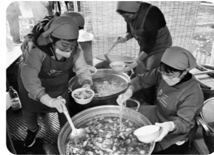
女性部が芋煮を調理