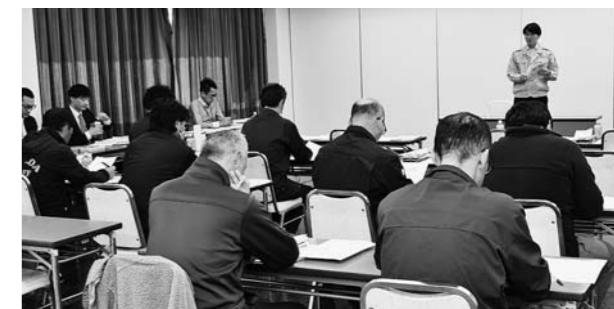
▲肥料・農業の知識向上のため開かれた研修会

肥料・農業の価格が高騰している中、様々な場面で組合員を中心に大口・担い手農家に生産コスト低減のための情報提供を行い、最大限のメリットを示すことにより農家手取りの最大化に向けて努めていきます。