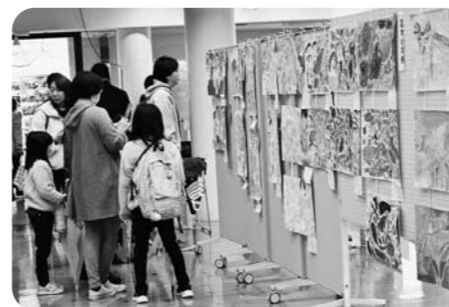
小学生の図画書道展