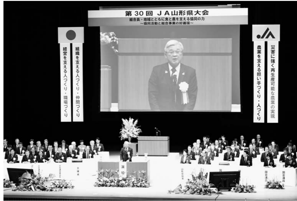
▲再生可能な農業の実現と3つの人づくりを最優先の取組実践方策として確認したJA山形県大会

11月20日、「第30回JA山形県大会」が山形市内の会場で開かれ、県内のJA関係者ら約800人が参加しました。大会では「組合員・地域とともに食と農を支える協同の好循環」をスローガンに「災害に強く再生可能な農業の実現」・「3つの人づくり」を、最優先の取組実践方策として確認しました。