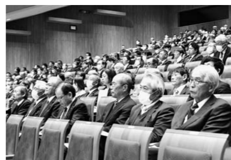
▲大会に出席した当JA関係者

11月20日、「第30回JA山形県大会」が山形市内の会場で開かれ、県内のJA関係者ら約800人が参加しました。大会では「組合員・地域とともに食と農を支える協同の好循環」をスローガンに「災害に強く再生可能な農業の実現」・「3つの人づくり」を、最優先の取組実践方策として確認しました。