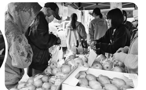
村山産業高校も農産物などを販売

ふるさと産業フェアが11月2日、村山市の産物プラザで開かれました。特産品販売や餅、りんごの無料配布に加え、同市産「つや姫」と「雪若丸」の新米の食べ比べやJA女性部が調理した芋煮を格安で提供しました。小学生のサトイモ体験活動の記録や図画、書道も展示。農産物の販売や友好都市である北海道厚岸町と宮城県塩釜市の物産展などが開かれ、新鮮な海産物も販売しました。戸沢小5年生は、JA青年部と育てた「はえぬぎ」を販売。用意した2 キ 入り120袋は完売しました。