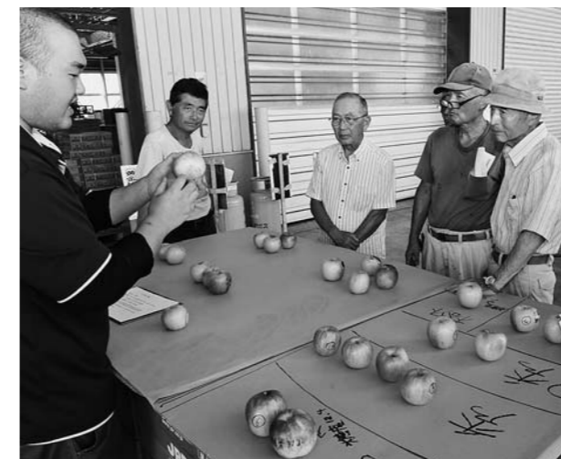
▲目揃え会で規格を確認する生産者たち

引き続き行われた目揃え会では、キズや日焼け、変形などのサンプルを用いて、共選規格の統一を図っていくことを確認しました。