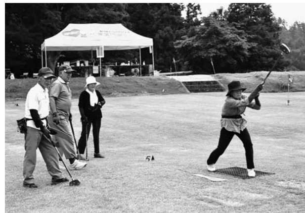
▲葉山・戸沢地区大会