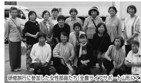
研修旅行に参加した女性部員たち(全農ライフサポート山形にて)

よねおりかんこうセンターでの昼食では、料理を味わいながら部員相互の親睦を深め、買い物を楽しんだり有意義な一日を過ごしました。