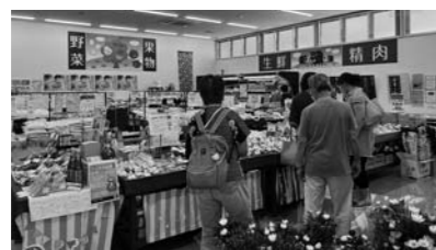
▲はいつでも大売り出し

8月9日、10日の2日間、JAグリーン4店舗でお盆大売り出しを行いました。肥料、農薬や秋まき用のタ