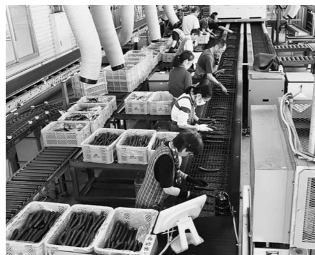
▲JAやまがたのきゅうり選果場での作業

今年も6人の生産者が選果場を利用。約100本入る専用のコンテナにきゅうりを並べ、JA本店敷地内の集荷場で集荷した後、専用のトラックで選果場まで運んでいます。日量約300コンテナほどが出荷されていて、9月末まで共同選果を行う予定です。