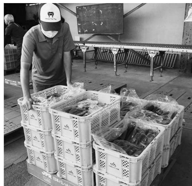
▲生産者がきゅうりの入ったコンテナを集荷所に搬入