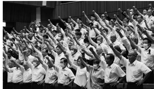
▶当JAの実行組合、生産組織の代表、役員も参加

6年7月豪雨による被害対策にかかる緊急要請では、被災した生産者の営農継続、生産基盤の維持・確保に向けた支援を強く働きかけました。生産者や青年部、女性部の代表ら4人が、豪雨災害や農業・農村を取りまく厳しい現状や生産者の思いを訴えました。