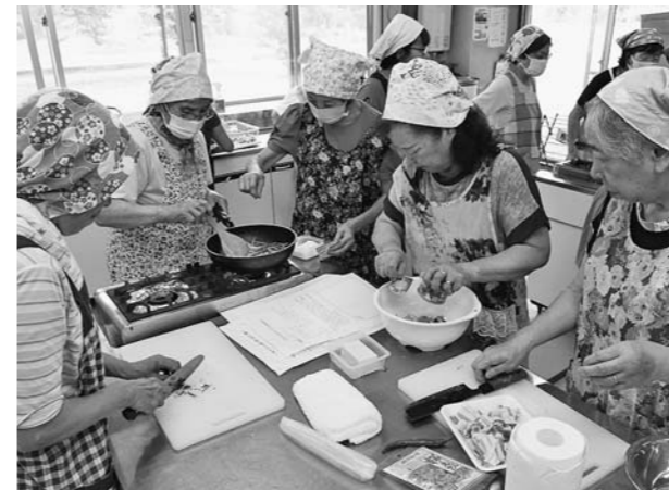
▲夏野菜を使った料理に挑戦する女性部員たち

完成した料理を試食した女性部員たちは、おいしさに舌鼓を打ち、出来栄に満足していました。