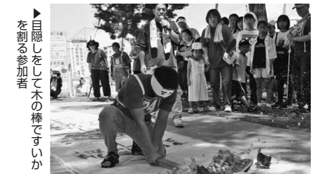
▶目隠しをして木の棒ですいかを割る参加者