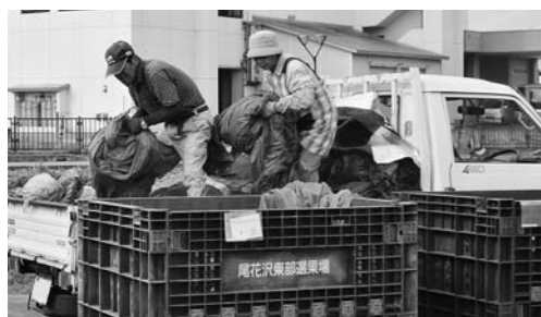
▲ビニールを回収用コンテナに入れる農家(尾花沢)

また、村山地区では9月5日から4日間、大石田地区では9月2日から3日間廃プラ回収が行われました。