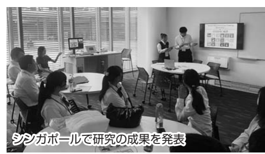
シンガポールで研究の成果を発表