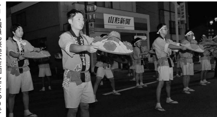
▶JA職員も豪快な笠回しでまつりを盛り上げ

8月24日の徳内まつりでは、楯岡支店の敷地内に「屋台村」をオープン。職員らが焼き鳥や焼きそば、かき氷、ビールなどを販売し、夏のまつりを盛り上げました。