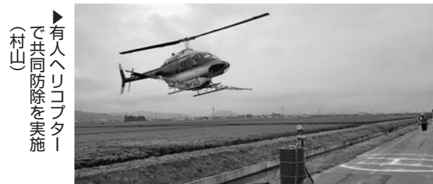
▶有人ヘリコプターで共同防除を実施(村山)

また、7月31日には、JA本店敷地内で村山市航空防除協議会役員や各関係機関、JA役職員が出席し、今年度計画された村山市内における航空防除事業の安全祈願祭を執り行いました。