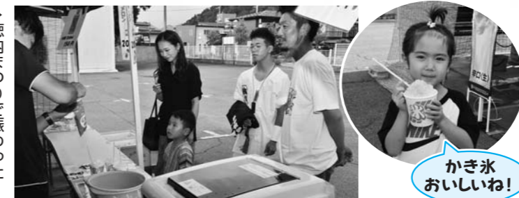
▶徳内まつりで賑わった「屋台村」