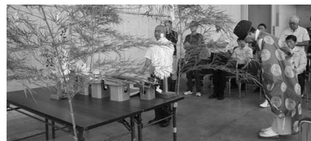
▲航空防除の安全祈願祭(村山)