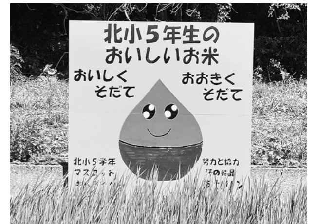
▲大石田町青年部が作成した看板

同青年部では、子供たちに土とのふれあいから自然や農業の大切さを学んでもらおうと、食農教育の一環として5月22日、児童たちに植え方などのアドバイスをしながら一緒に田植えを行いました。その田んぼの脇に設置されたもので、JA県青協主催の手づくり野立て看板コンクールに出品する予定です。