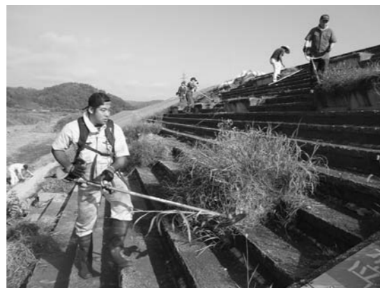
▲草刈り作業をするみちのくサービスの社員たち

〔株〕みちのくサービス社員会の地域貢献活動 (株)みちのくサービス社員会は8月3日、大石田まつり花火大会機敷席周辺の清掃活動を行いました。地域貢献活動の一環として実施したもので、社員10人が参加しました。猛暑が続くため当日は、朝7時から2時間ほど草刈り、ごみ拾いを行いました。終了後、きれいな環境を見、あらためて地域貢献の大切さを実感し、とても有意義な活動になりました。