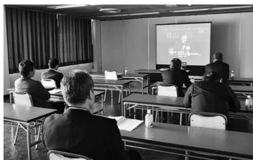
▲オンラインで参加した当JAの役職員

JAグループは5月10日、東京都千代田区で「食料・農業・地域政策推進全国大会」を開きました。与党議員をはじめ、オンラインを併用して全国のJA代表ら4000人が参加しました。