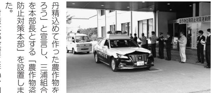
▲巡回活動に出発する関係者ら

対策本部設置に伴い、同本部長より村山・尾花沢・大石田の営農センター長に自主警戒パトロール用の腕章が伝達され、各班に分かれてさっそく巡回活動に出発しました。近年、同JA管内ではさくらんぼの盗難事件は発生していませんが、県内では毎年発生しています。警察による巡回だけでは限界があり、生産者やJA、自治体、その他関係機関とも連携して盗難被害防止運動を展開していくことを確認しました。