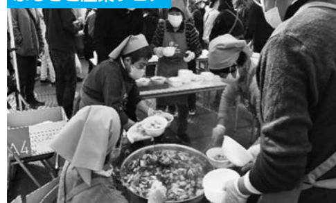
11月3日村山市の産物プラザで「ふるさと産業フェア」が開催され、JA女性部の協力で作られた芋煮が振る舞われました。