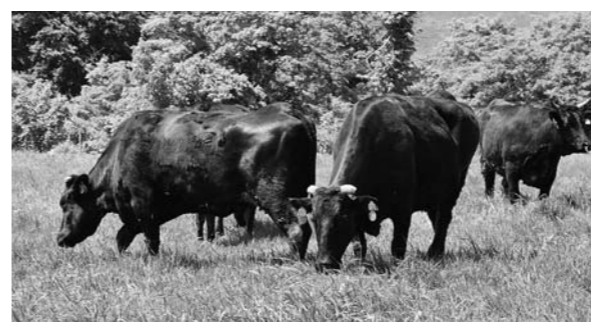
▲雄大な牧場に放たれ、牧草をはむ牛

を入れていく。今後も繁殖牛の増頭や施設整備を支援していく。今回入牧した牛については、下牧まで元気に過ごせるよう努めていく」とあいさつしました。牧場は、標高500以上に位置し、夏でも牛には過ごしやすいく候で、自然の牧草をたっぷり食べて過ごします。10月下旬の下牧する頃には、体重も大幅に増え、起伏のある草地で運動することで、足腰の強い健康な牛に育ち、農家の元に帰って行きます。