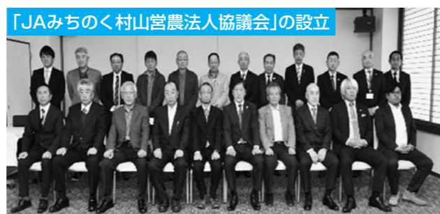
3月28日「JAみちのく村山営農法人協議会」を設立。設立により、農業法人の連携を強め、また情報や課題を共有し、農産物の高品質生産により有利販売を図り、地域農業の振興を目指します。