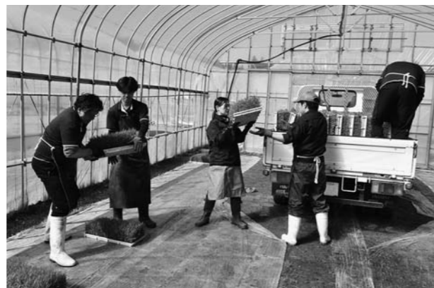
▲苗箱を組合員のトラックへ積み込み（尾花沢）

どの施設も、ピークの時期には早朝から農家のトラックの行列ができ、従業員や職員によって次々に積み込まれました。