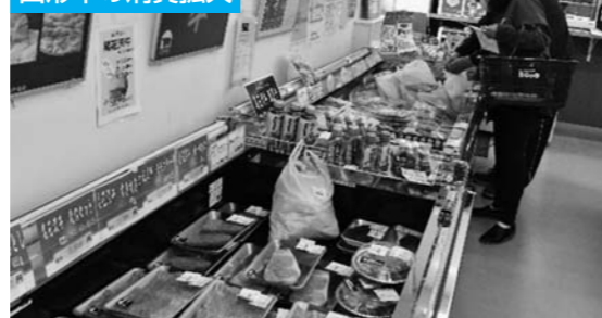
おばね産直館「はいつと」では、様々なイベント時だけでなく、1年をとおして山形牛の販売をおこない、消費拡大に取り組んでいます。

当JAは組合員との徹底した対話に基づいて「農業者の所得増大」「農業生産の拡大」「地域の活性化」を基本目標とする創造的自己改革の実践に取り組んでおります。