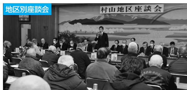
3月4日、3月5日の2日間、管内3地区で座談会を開催。様々な機会でご意見、ご要望は十分な検討を重ね、今後のJA事業運営に反映させていただきます。

また、令和5年度から実施している全事業を対象とした「みちのく村山プログラム」の開催で事業計画・自己改革の取り組みの進捗状況を確認し確実に実践していき、事業の抜本的な見直し・検討も含め、直接販売事業の強化と生産性の向上、施設の経営効率化に取り組み、さらなる事業の発展をめざしてまいります。