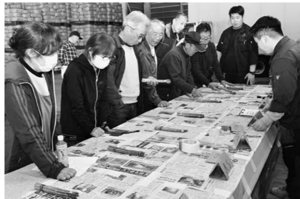
▲アスパラガスの出荷規格を確認する部会員

JA職員が出荷規格や収穫時の注意点などを説明。参加した生産者は出荷規格の見本を手に取り、傷や穂の開き、結束テープの位置などを細かく確認しました。