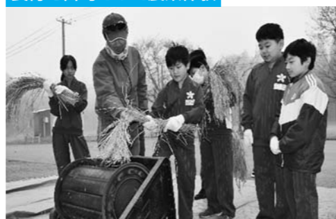
食育教育を目的とし、子供たちに土のふれあいから自然や農業の大切さ、食と農のかかわりを学んでもらおうと、年間をおしてその支援活動に取り組んでいます。