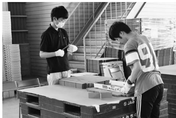
▲返礼品さくらんぼのダンボールの組み立て作業

JAと地域との結びつきを大切にするという地域社会への貢献の一環として農福連携で昨年引き続き取り組みました。この農福連携とは、農業分野の課題である労働力不足と福祉分野の課題である障害者雇用・就労機会の拡大について、解決に向けてJAと社会福祉協議会がマッチングを行うことであり、当JAのふるさと納税返礼品発送には多くの労働力が必要となることから、今回の連携は感謝しています。