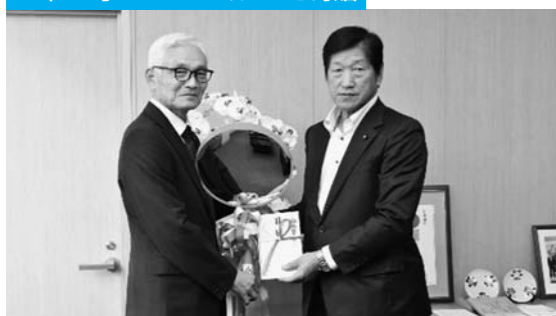
当JAとJA共済連山形は、令和5年度2市1町に16基のカーブミラーを寄贈しました。昭和48年から累計で1,105基になります。