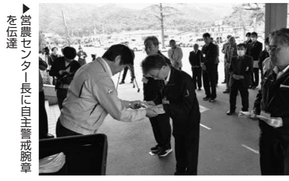
▶営農センター長に自主警戒腕章を伝達