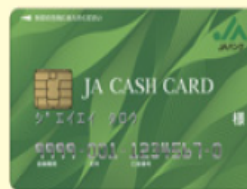
ICキャッシュカード