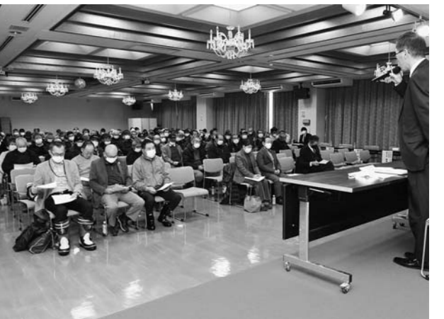
▲米生産者らが参加したフォーラム

講演では、水田活用の直接支払交付金の交付対象水田や畑地化促進事業について、見直しになった点も含めて説明。施策について活発に質疑応答が行われました。