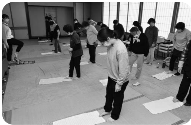
▲タオルを使った体操を実践する女性部員たち

タオルを使うなど新体操の経験を生かした体操を紹介し、参加者は日常生活の中で簡単にできる健康体操を学びました。