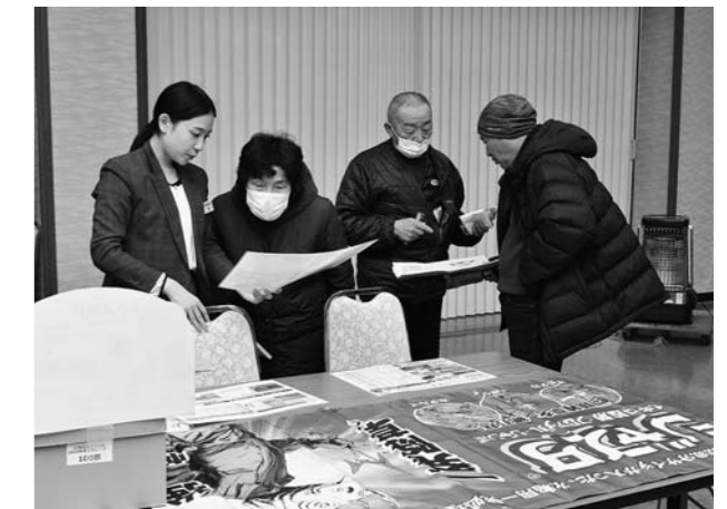
▲メーカーの担当者から農業の説明を聞く生産者(大石田)