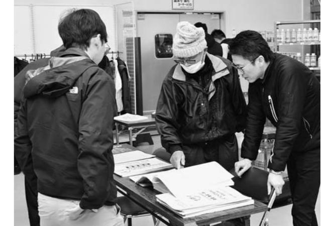
▲早期予約申し込み内容について相談(村山)

1月17日に大石田地区、27日に尾花沢地区で令和6年用の肥料・農業の早期予約を取りまとめるための相談会が各営農センターで開かれました。村山地区はJAグリーンごてんで1月10日から19日まで品目ごとに相談会を開催。いずれの地区でも、メーカーの担当者も出席し、新商品の紹介や商品の使用時期、効果などの質問にも対応。JAの担当職員からは肥料・農業の早期予約のメリットなどの説明が行われました。