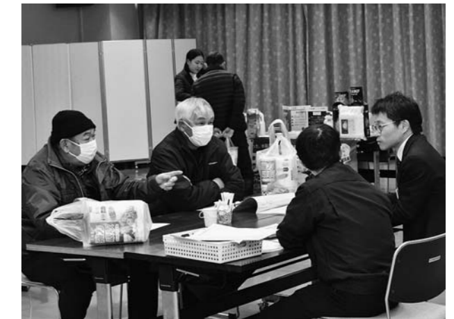
▲防除基準の説明を聞く生産者たち(尾花沢)