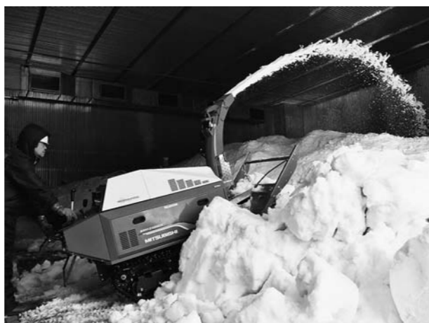
▲除雪機で天井近くまで積み上げられていく雪の搬入作業

当JAの本店敷地内にある雪室施設「零温雪室倉庫」で、1月18日から雪入れが始まり、連日作業が続いています。例年、JA本店敷地内を除雪した雪を搬入していますが、今年は暖冬の影響で雪が少なく、尾花沢市内と大石田町内にあるJA施設の軒先など積みつけた雪をダンブで運び搬入しています。 「零温雪室倉庫」は、延床面積約4000平方メートル、玄米貯蔵量約3600トンを誇り、本州最大規模。高さ8メートル、広さ540平方メートルの貯雪庫に、大型のホイールローダーとダンブを