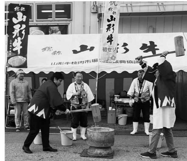
▲初せりに先立ち、餅つきが行われ関係者に振る舞われた