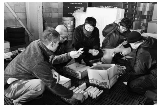
▲たらの芽のサンプルで出荷規格を確認する生産者

たらの芽の出荷は4月下旬まで続く予定で、JA全体では、7300 + の出荷を目指します。