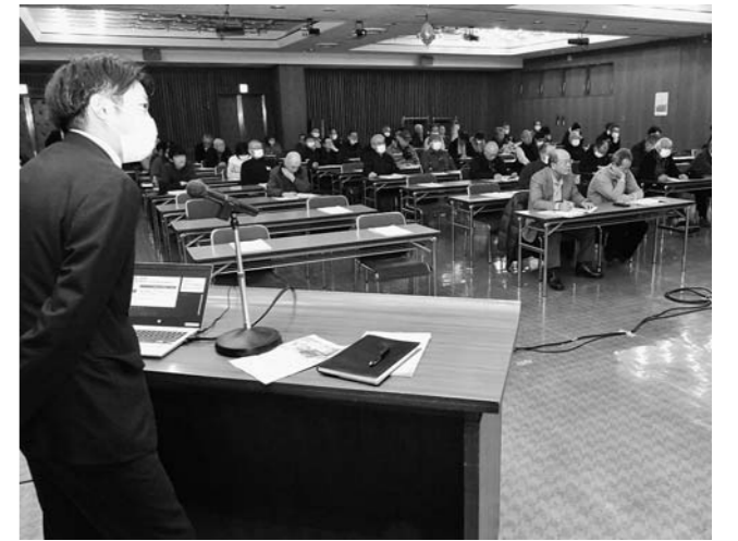
▲やまがた紅王の栽培技術を学ぶ参加者

村山総合支庁北村山農業技術普及課と当JAは1月9日、JA本店でさくらんぼ「やまがた紅王」の栽培研修会を開きました。