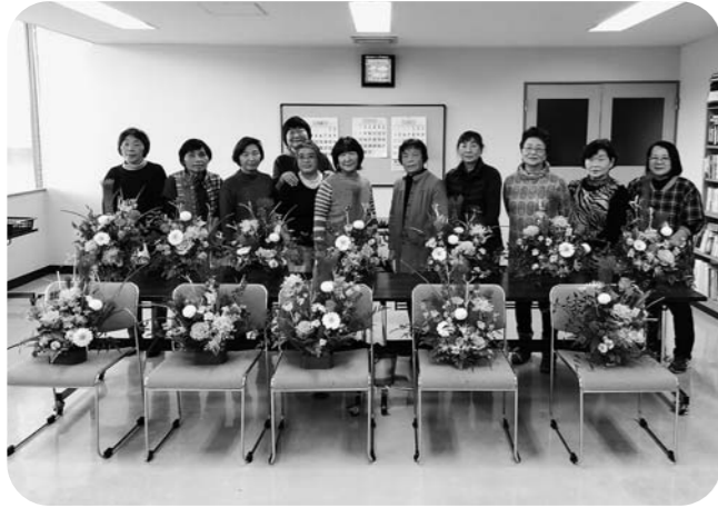
▲個性あふれる作品に大満足の女性部員たち

支部の女性部員11人が参加。一本一本丁寧に色とりどりの花を生け、個性あふれる作品が出来ました。