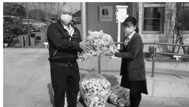
▲ペットボトルのキャップをクリーンシステムに寄付

集められたキャップは、福祉施設へ車椅子や消毒液の購入に役立てて貰おうと、(株)クリーンシステムへ寄付しました。この活動は今後も継続して行っていく予定です。