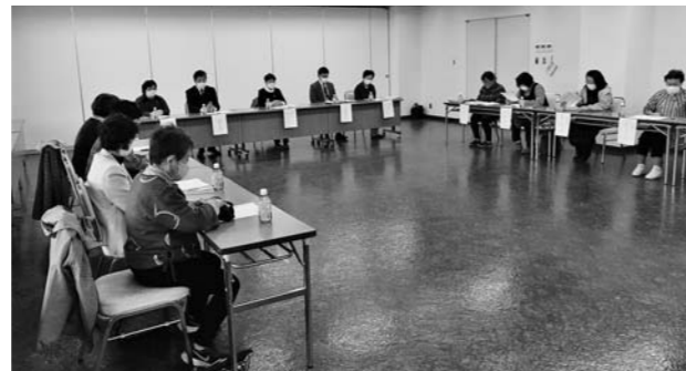
▲令和5年度の活動を確認した会議

また、賞味期限内の食べ物を持ち寄り、支援を必要としている個人や団体に無償で提供する「フードドライブ活動」にも取り組み、JA事業にも積極的に参画していくことを確認しました。