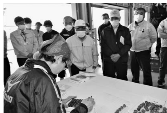
▲県の現地研修会でされた箱詰め講習会(4月18日)