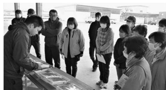
▲JAの担当者から出荷規格などの説明を聞く生産者たち(4月12日)