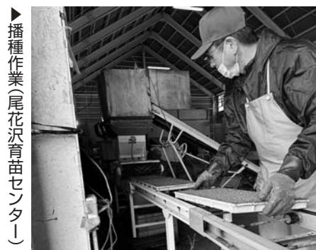
▶播種作業(尾花沢育苗センター)