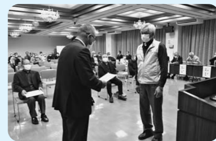
▲委嘱状交付式(尾花沢)