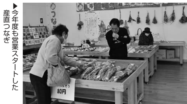
▶今年度も営業スタートした産直つなぎ