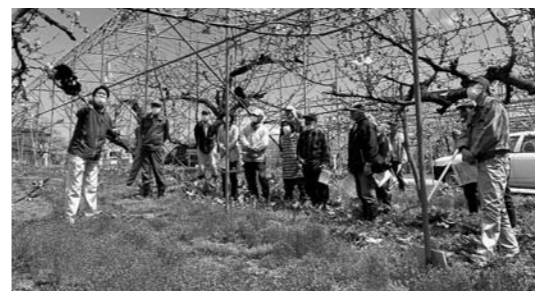
▲毛ばたきを使い受粉作業の実演が行われた結実対策講習会(4月19日)