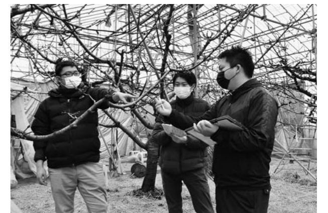
▲園地を巡回し、さくらんぼの生育状況を確認する北村山農業技術普及課の職員とJA職員

また、被害が発生した場合には速やかに状況を把握し、行政と連携を図りながら雪害対策に努めていきます。