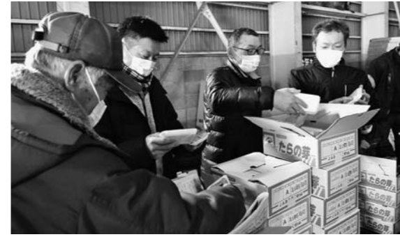
▲たらの芽の出荷規格を確認する生産者(尾花沢)