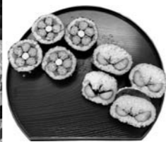
▲完成した2種類のデコ巻き寿司(左が小梅、右がタンポポ)