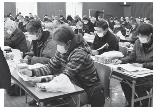
▲防除基準の説明を聞く生産者たち(村山)