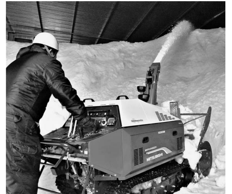
▲除雪機で天井近くまで積み上げられる雪

当JA本店敷地内にある雪室施設「零温雪室倉庫」で、1月10日から雪入れが始まり、連日作業が続いています。延床面積約4000平方メートル、玄米貯蔵量約3600トンを誇るこの雪室施設は本州最大規模。高さ8メートル、広さ540平方メートルの貯雪庫に、JA本店敷地内を除雪した雪を大型のホイールローダーとダンプを使って搬入し、除雪機で天井近くまで飛ばし積み上げます。この施設は、貯雪庫に隣接