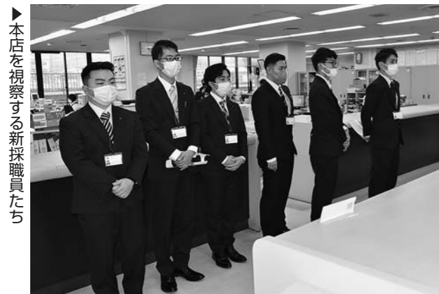
▶本店を視察する新採職員たち

手芸教室は毎月実施していて、今回は使い古しの帯を再利用し手提げ袋作りに挑戦。型紙に沿って布を切り縫い合わせ、出来上がったオリジナルの手提げ袋に参加した女性部員らは満足していました。