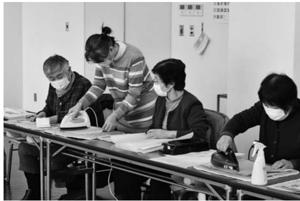
▲天然のラップ作りを体験する役員たち

村山地区女性部の役員と事務局の合同会議が1月19日に本店会議室で開かれ、役員15人が出席しました。会議では、総代会の日程について話し合わせ、3月4日に実施することに決まりました。終了後には、「SDGsと女性部活動」(仮称)をテーマに講演会を予定することを確認しました。