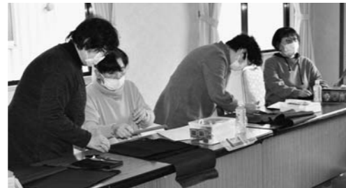
▲手提げ袋作りに挑戦する女性部員たち

大石田地区女性部は1月11日、大石田営農センターで手芸教室を開き、女性部員11人が参加しました。