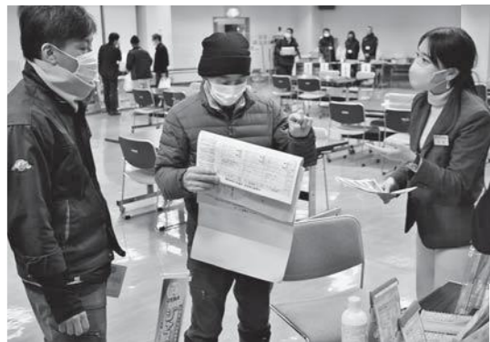
▲自分の栽培にあった使用を相談(尾花沢)