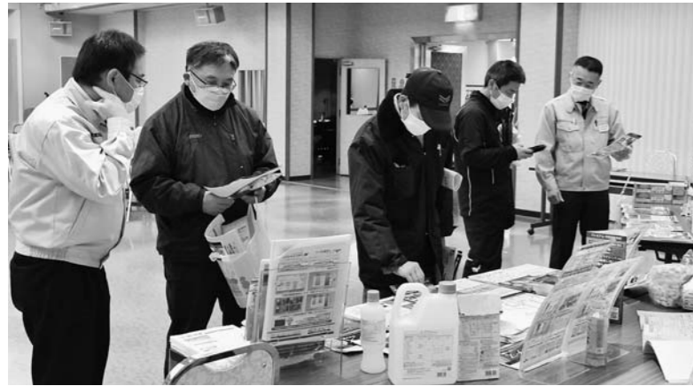
▲早期予約申し込みの内容について相談(大石田)