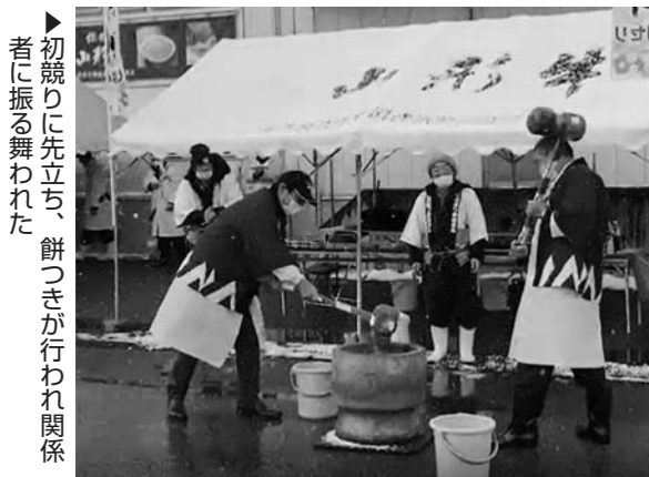
▶初競りに先立ち、餅つきが行われ関係者に振る舞われた

1月10日、山形市にある株式会社「総称山形牛」の初競りが行われました。県内の畜産農家が10頭の枝肉を出品。このうちJA管内からは41頭が出品され、1頭1頭肉質や脂質を確かめ競り落とされました。また、初競りに先立ち、餅つきが行われ、生産者や関係者に振る舞われました。 この日の最高値は、尾花沢市で肥育された雌牛。1キロあたり3,372円で、昨年よりも300円以上アップしました。