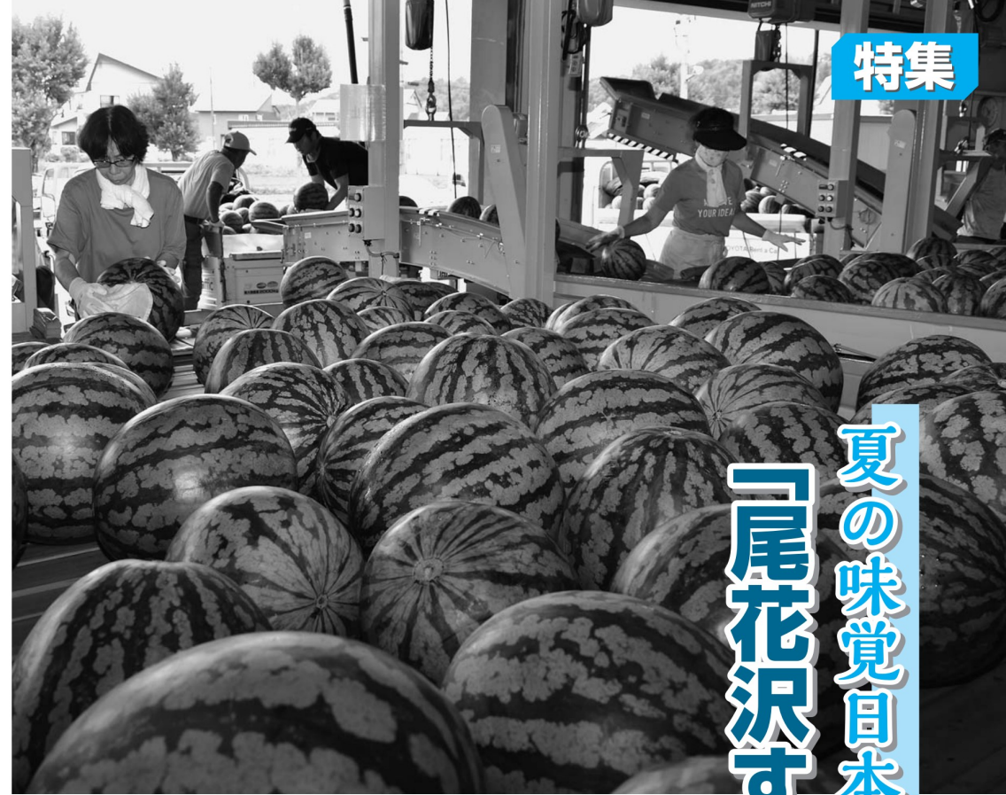
▲荷受け台に並べられた「尾花沢すいか」（西部選果施設）

すいか出荷協議会で目標必達誓った 本格的な出荷を目前に控え、当JAのすいか生産部会は7月5日、本店で「令和4年度すいか出荷協議会」を開き、 「協議会には、生産者の代表と重点取引市場6社の販売担当者31人が出席し、出荷数量105万ケース、販売額27