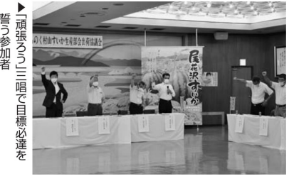
▲「頑張ろう」三唱で目標必達を誓う参加者

呼びかけ、出荷のスケジュールを全員で確認しました。同様の「試し割り」は、7月8日に西部すいか選果場施設でも行われました。