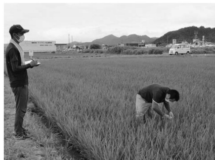
▲圃場で葉色値を測定