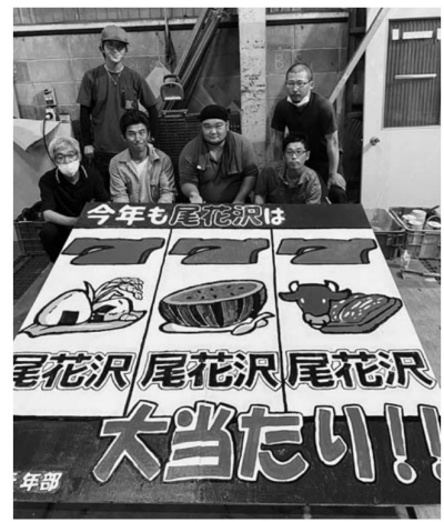
▲尾花沢市青年部が作成した看板