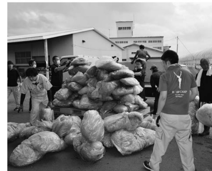
▲2日間で11トンのポリを回収