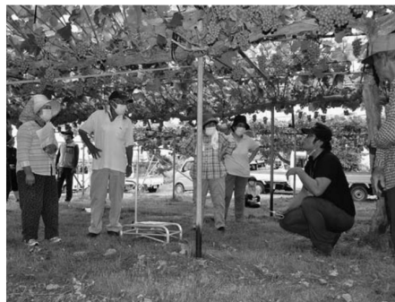
▲資料を見ながら栽培管理について確認する生産者

北村山農業技術普及課の小口普及指導員が講師となり、収穫前管理として摘房・摘粒や笠かけ、かん水について、等級アップを狙いポイントを説明し実演。参加した生産者は大粒生産と良品出荷に向けて、今後の栽培管理について確認しました。