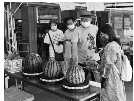
▲道の駅尾花沢「花笠の里ねまる」

特産「尾花沢すいか」の出荷最盛期にあわせて、7月20日から管内3カ所で直売所「すいか村」をオープンしました。尾花沢市では、JAグリーンおばなざわに隣接する「産直館はいつと」の店舗前と、道の駅尾花沢「花笠の里ねまる」の敷地内で、また、大石田町では「産直つなぎ」の前でそれぞれテントを設置。テント内には、選果施設で選果されたばかりの大きすいかの箱が積み重ねられ、さっそく県内外から訪れたお客が買い求めていました。 すいこの「すいか村」も、8月15日頃まで直売と全国発送を行っています。