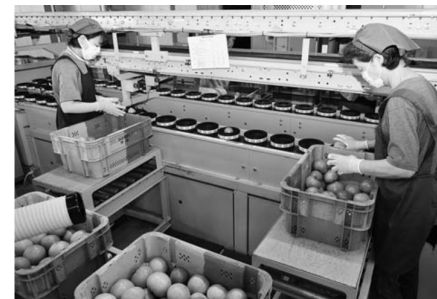
▲目視によるトマトの選果作業