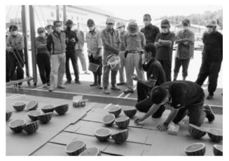
▲試し割りを見守る生産者（東部選果施設）

東部すいか選果施設前で7月7日、特産「尾花沢すいか」の出荷の目安を判定する「試し割り」が行われ、今後の出荷時期の目安を確認しました。 同施設を利用する尾花沢市、村山市の生産者とJA職員あわせて約50人が集まり、15個のすいかを着果日ごとに並べ、包丁を入れて一つひとつ糖度計で糖度を確認。着果日ごとの生育状況を記録し報告されました。 担当の職員からは「品質のばらつきに注意して的確な管理・収穫を心掛け、一個でも多く出荷をお願いしたい」と