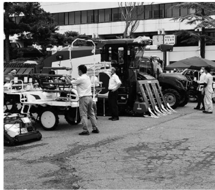
▲会場には最新の農業機械が展示された

㈱みちのくサービス村山農機センターは7月21日、本店前の特設会場において農業機械の展示・試乗会を開催しました。主要メーカー6社が参加し、これからの農業を見据えた最新機能を搭載した大型トラクターやコンバイン、田植機などを展示。自動運転機能(無人仕様)を搭載した農業機械やドローンの実演も行われました。