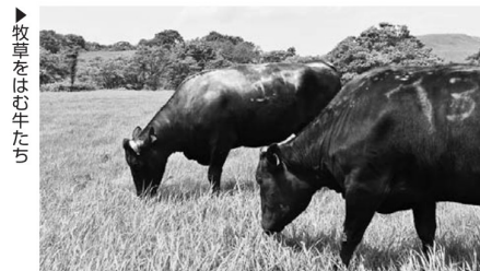
▶牧草をはむ牛たち