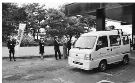
▲巡回活動に出発する関係者ら

過去5年間、当J A管内ではさくらんぼの盗難事件は発生していませんが、県内では毎年発生している状況にあります。警察による巡回だけでは限界があり、生産者やJ A、自治体、その他関係機関とも連携をとりながら盗難被害防止運動を展開していくことを確認しました。