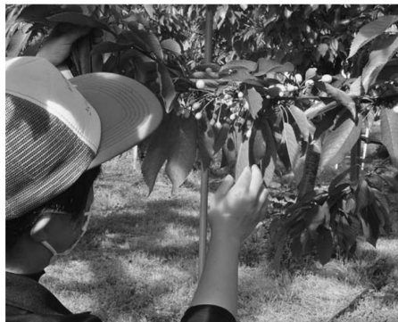
▲作況調査をするJA職員

また、村山営農センターは5月23日、村山市の園地24カ所にてさくらんぼの作況調査を行いました。JA、北村山農業技術普及課、村山市役所、全農山形の職員が参加し調査しました。