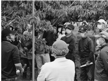
▲作業手順を確認する生産者(葉山地区)

村山営農センターさくらんぼ生産部は5月17日~20日に村山市内の各地区(楯岡・西郷・葉山・戸沢)の園地で収穫前の管理講習会を開きました。