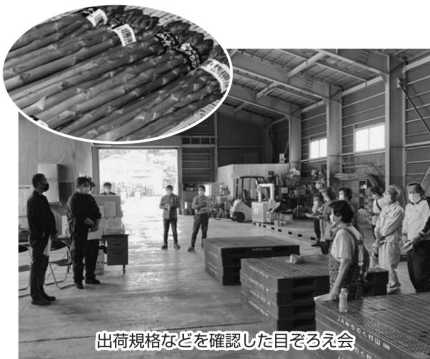
出荷規格などを確認した目ぞろえ会

どの施設も、ピークの時期には早朝から農家のトラックの行列ができ、従業員や職員によって次々に積み込まれました。