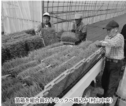
苗箱を組合員のトラックへ積み込み(村山中央)