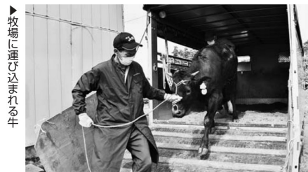
▶牧場に運び込まれる牛

過去5年間、当J A管内ではさくらんぼの盗難事件は発生していませんが、県内では毎年発生している状況にあります。警察による巡回だけでは限界があり、生産者やJ A、自治体、その他関係機関とも連携をとりながら盗難被害防止運動を展開していくことを確認しました。