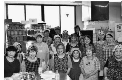
▲優秀賞を受賞した写真

笑顔があふれる、明るく楽しい女性部活動を広く知ってもらおうと、仲間づくりの運動を一層推進するために山形県JA女性組織協議会が開いたもので、当JA女性部が優秀賞を受賞しました。