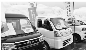
▲さまざまな車種を展示