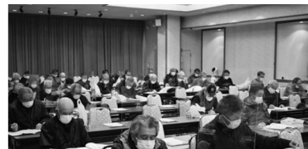
▲資料を確認しながら説明を聞く生産者

【タラノメの目揃い会を開く】 尾花沢営農センター山菜部会は1月21日、中の段集荷場でタラノメの目揃い会を開きました。本格的な出荷を控えて開催されたもので、部会員20人が参加。等階級ごとに分けられたサンプルを手に取り、出荷規格やパックの詰め方などを確認しました。