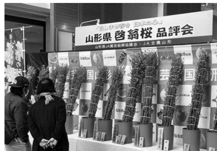
▲入賞した啓翁桜が並びました

【啓翁桜の品評会が開催される】 1月26日、山形市内の会場で令和3年度山形県啓翁桜品評会が開かれました。啓翁桜の品質向上と出荷規格の統一を図ることを目的に毎年行われています。今回の品評会には県内のJAから63点が出品され、花つきや花色、枝ぶり、一把の姿と全体のバランスの観点を重視し審査されました。