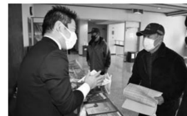
▲展示コーナーで農業メーカーの説明を聞く生産者(右)

【農業の早期予約運動説明会を開く】 1月13日、大石田営農センターで組合員や農業メーカーなど約60人が出席し、令和4年用農業の早期予約運動説明会が開かれました。コロナ禍の中で感染拡大防止対策を実施し2年ぶりに開催。JA担当職員が早期予約申込にかかわる要領やメリットについて説明し、各農業メーカーは自社の新商品やイチオシ商品の効力や使い方などについて詳しく紹介しました。また、会場内には展示コーナーが設けられ、訪れた組合員は気になった商品の説明をメーカー担当から直接聞き、理解を深めていました。