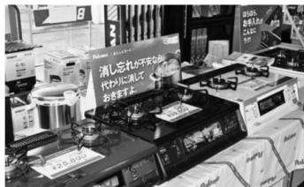
▲テーブルコンロを特別価格で