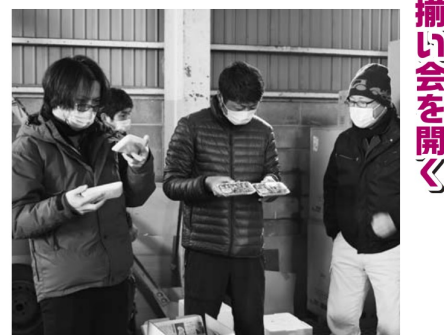
▲サンプルを確認する生産者

【タラノメの目揃い会を開く】 尾花沢営農センター山菜部会は1月21日、中の段集荷場でタラノメの目揃い会を開きました。本格的な出荷を控えて開催されたもので、部会員20人が参加。等階級ごとに分けられたサンプルを手に取り、出荷規格やパックの詰め方などを確認しました。