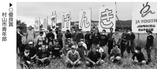
▶優良賞 村山市青年部

【豪雪対策本部を設置】 1月19日、JA本店に豪雪対策本部を設置しました。当管内では積雪量の増加に伴い、果樹の枝折れやハウスなどの農業施設に対する被害、融雪遅れによる春作業への影響が懸念されることから、各営農センターを中心に被害未然防止の呼びかけ活動を展開してまいります。また、被害が発生した場合には速やかに状況を把握し、行政と連携を図りながら雪害対策に努めてまいります。