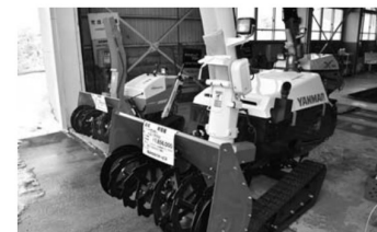
▲各メーカーの除雪機を展示

【柳みちのくサービスで初売りイベント】 柳みちのくサービスは1月20日と21日、村山と尾花沢の農機車両センターで新春初売りイベントを開催しました。両会場ともに乗用車や除雪機、ガス器具などを展示・販売し、期間中はお楽しみ抽選会も行われ、多くの方が来場しました。