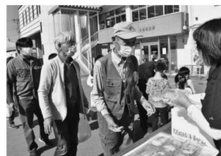
▲限定100食! 納豆餅の振舞い

JAグリーンおおいしだ特設会場で開催。大人気の焼きそばや焼き鳥などの屋台コーナーが設けられテイクアウトで販売されました。大石田農産物直売所「つなぎ」も出店し大根や白菜、ネギなどの新鮮な秋野菜を販売した他、(株)みちのくサービスは石油ファンヒーターなどのあったか家電、除雪機やスタッドレスタイヤなどを展示・販売しました。