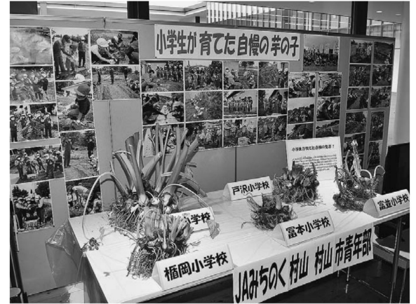
▲展示した活動の記録