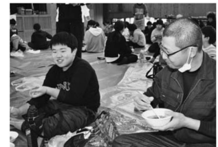
▲青年部員といただきます!