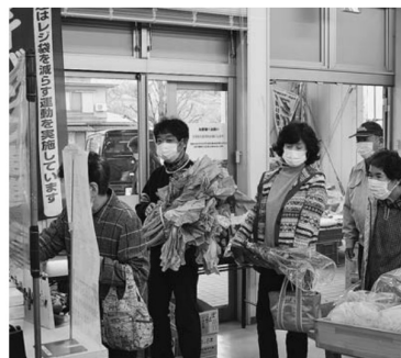
▲レジの前は大行列