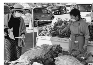
▲産直会員(右)が料理のレシピや調理のコツを伝授