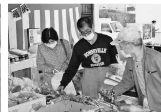
▲「つなぎ」の出張販売