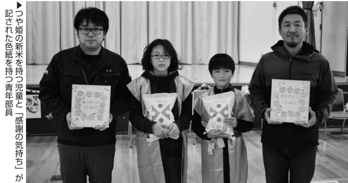
▶つや姫の新米を持つ児童と「感謝の気持ち」が記された色紙を持つ青年部員

11月25日、大石田地区青年部は大石田町立大石田北小学校を訪れ、地域の生産者が大切に育てたお米を味わってもらおうと、大石田産「つや姫」の新米を贈呈しました。同青年部では田植えや稲刈りなどを指導しており、この日は児童たちによる「感謝会」も開かれました。