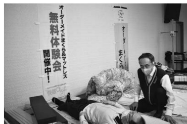
▲寝心地を確認するお客さま

尾花沢営農センターで尾花沢経済事業所と大石田経済事業所が合同開催。宝飾品をはじめ、衣類や寝具、家電製品などを展示・販売した他、先着100名様には尾花沢牛肉まんミ二がプレゼントされました。