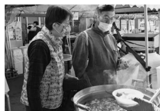
▲出来立てのいも煮をどうぞ

産直会員が丹精込めて栽培した野菜を特設会場で販売。訪れたお客さまには、料理のレシピや調理のコツなどを丁寧に説明。安くて新鮮な野菜を買い求めるお客さままでにぎわいをみせました。期間中は「いも煮茶屋」がオープンし、出来立ての山形名物いも煮が用意されました。