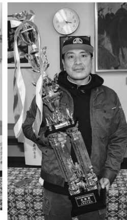
▲名誉賞に輝いた折原さん