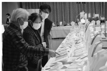
▲宝飾品を選ぶお客さま