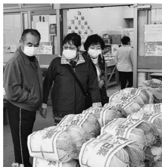
▲店舗前にもたくさんの野菜が用意されました

開店と同時に白菜や青菜などの秋野菜を買い求めるお客さまで店内は大行列。店舗前では人気の高い「はいからさんのカーパン」などを販売。500円以上お買い上げいただいた方には粗品がプレゼントされました。