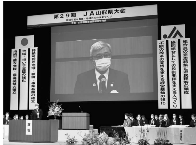
▲あいさつする折原会長