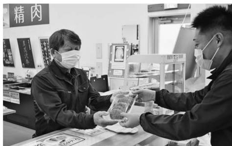
▲出来立ての牛肉コロッケをどうぞ!

サーロインや焼肉セットなどの尾花沢牛を特別価格でご用意。野菜や果物、キノコ類などを1袋1000円で詰め合わせたお楽しみ袋とフードコーナーでは牛肉コロッケやハムカツなどを販売しました。