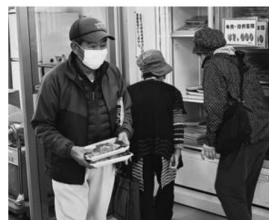
▲収穫感謝祭にあわせ、店舗内では県内産の牛肉や豚肉を販売しました