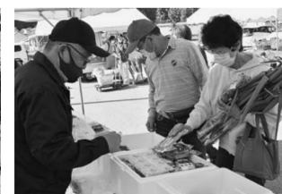
▲尾花沢農産加工が漬物を出張販売