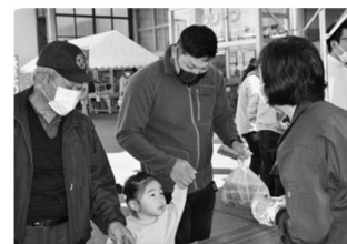
▲焼きそばをお持ち帰りどうぞ