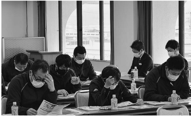
▲研修会に出席した職員

肥料・農業研修会を開催 11月18日、当JA本店で経済部門を担当している職員を対象に、肥料・農業研修会が開かれました。職員の知識向上を図り、組合員対応に磨きをかけるのが狙いで、各メーカーから新商品等の説明を受け、参加した職員は熱心に耳を傾けていました。当JAではなお一層、農家手取りの最大化に向けて努めてまいります。職員が訪問した際にはよろしくお願いたします。