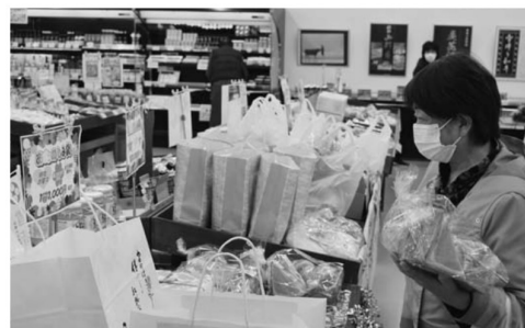
▲お楽しみ袋を選ぶお客さま