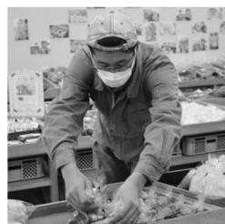
▲開店前に野菜を陳列する生産者